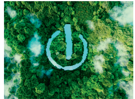
NACHHALTIGKEIT & ENERGIESPAREN